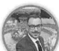
LEONARDO BUFFO SECONDIRIA DI PRIMO GRADO