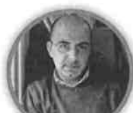
GAETANO SCOGNAMIGLIO SECONDIRIA DI SECONDO GRADO