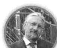
MASSIMO TAVOLA SECONDIRIA DI PRIMO GRADO